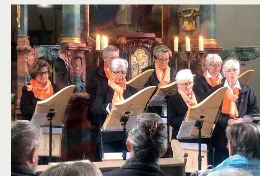
KREIS WÜRZBURG Maiandacht mit der Veeh- Harfengruppe