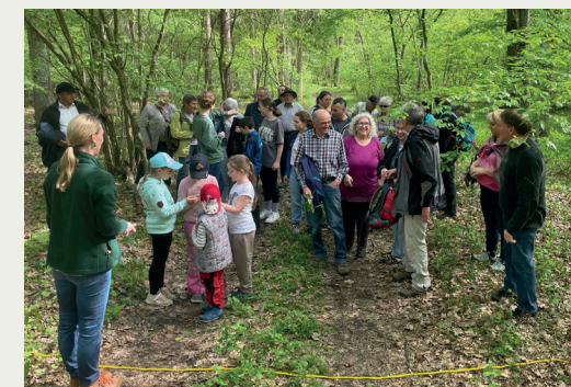
FRANKENWINHEIM Interaktives Walderlebnis begeisterte