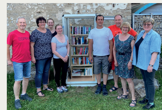
EUERFELD Neuer Bücherschrank in der Ortsmitte

Das erste Treffen des Aktionsteams findet am Dienstag, 1. Oktober, um 19.30 Uhr im Bildungshaus Himmelsporten in Würzburg statt. Herzliche Einladung an ALLE, sich hier einzubringen, um die KLB zukunftsfähig mit zu gestalten. (Siehe dazu auch: Neues Strukturmodell, Seite 2)